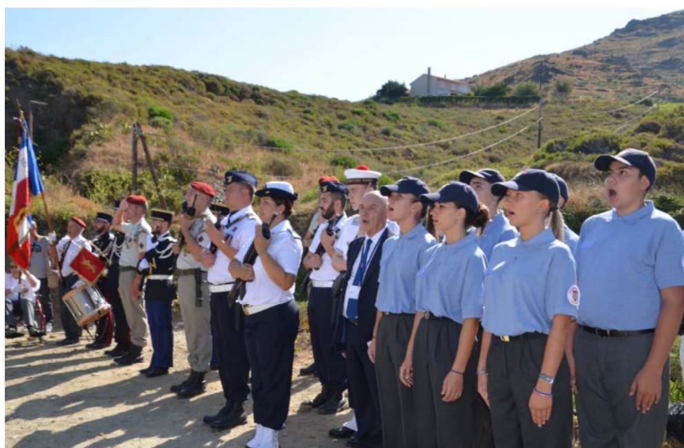
Chant de la Marseillaise par les Cadets de la Défense