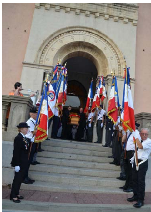
Haie d'honneur à la sortie de la messe