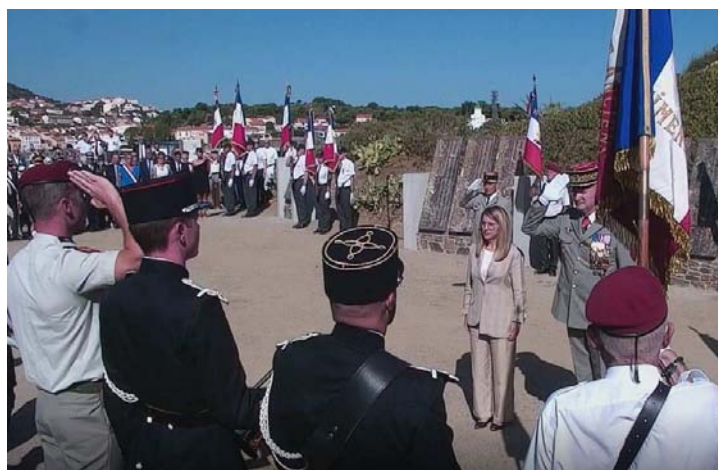
Honneurs militaires à la Secrétaire d'Etat et au général Inspecteur des armées